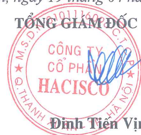
Đinh Tiên Vịnh